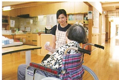
生徒の高齢者施設でのボランティア体験学習の様子