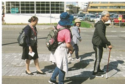
認知症高齢者等の SOS ネットワーク検索模擬訓練の様子