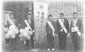
赤い羽根 共同募金運動街頭募金にご協力いただきました。

現在、釧路町ボランティアセンターには10のボランティア団体が登録しています。今回はその中の1団体を紹介します。