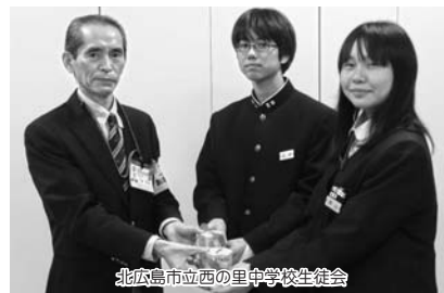
北広島市立西の里中学校生徒会