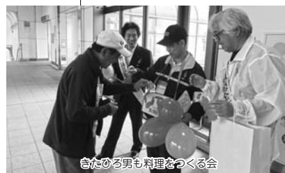
きたひろ男も料理をつくる会