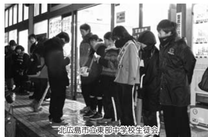
北広島市立東部中学校生徒会