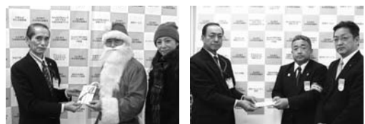
きたひろクラーク音楽祭実行委員会 寄付 北海道中央バス労働組合 寄付