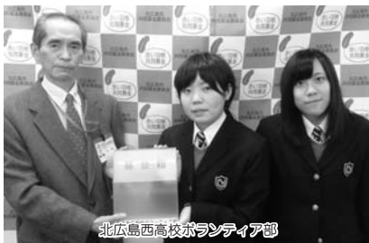
北広島西高校ボランティア部