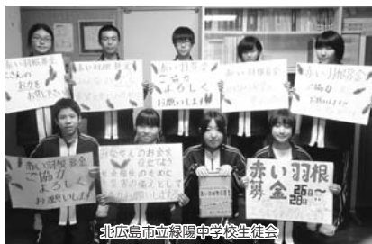
北広島市立緑陽中学校生徒会