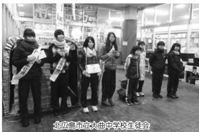
北広島市立大曲中学校生徒会