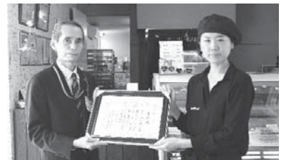
北海道支部からの表彰状を伝達 西の里にあるARTLACZE (有)博陽スクエア