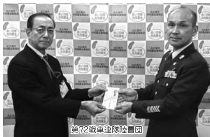
第72戦車連隊陸曹団