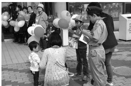
▲昨年の街頭募金の様子

平成25年度は、北見市では12,060,905円もの募金協力をいただきました。お寄せいただいた募金は、北海道共同募金会にとりまとめられ、平成26年度に北見市の福祉施設や学校、町内会などが行う多くの事業へ助成されました。ありがとうございました。