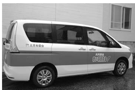
▲助成により購入した車輛