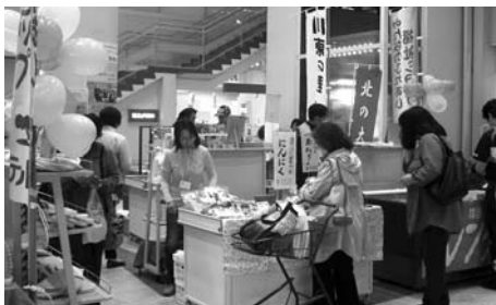
▲昨年のセールの様子