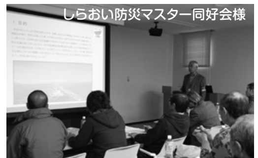
しらおい防災マスター同好会様

また、併せて消防本部庁舎内見学と昨年発足された「しらおい防災マスター同好会」の方にお越し戴き、活動紹介を交えながら白老町での防災活動の周知をして戴きました。