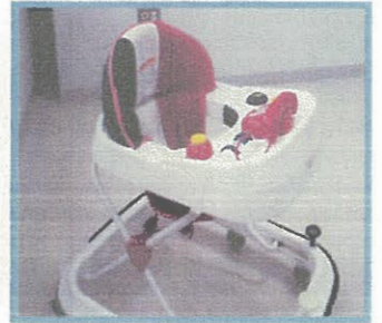
ベビーウォーカー