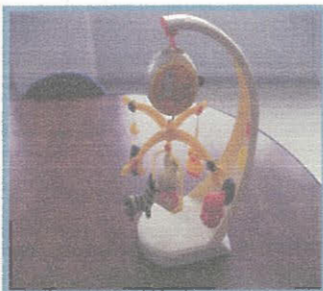
メリーゴーランド