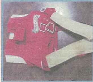
チャイルドシート（着席式）