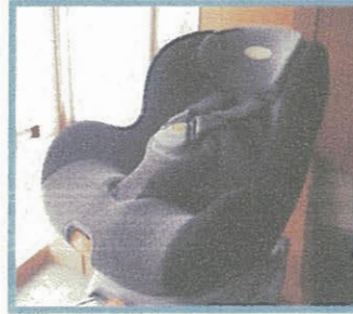
チャイルドシート