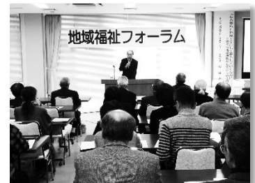
※昨年度の地域福祉フォーラムより