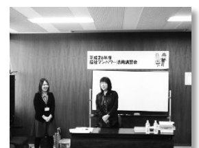
※昨年度の福祉マンパワー活用講習会より