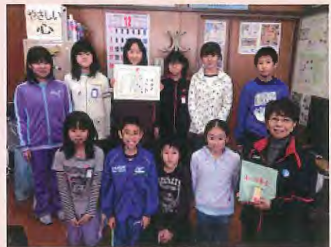
（釧路市立光陽小学校）