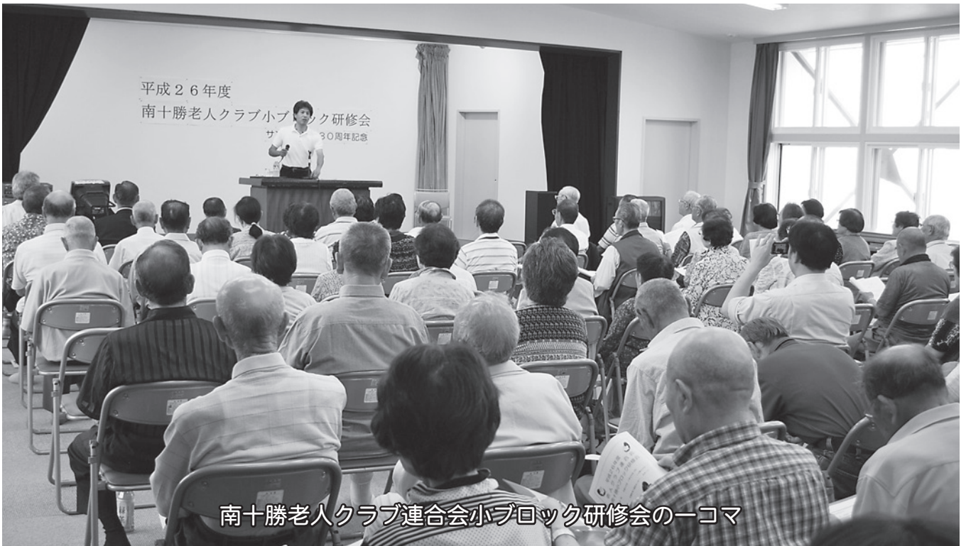
南十勝老人クラブ連合会小ブロック研修会の一コマ