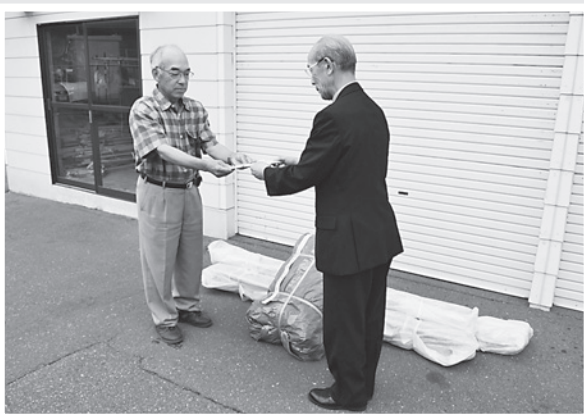
↑ 茂寄町内会へ目録の贈呈

平成25年度の北海道共同募金の実績が確定し、北海道共同募金会より昨年度申請をしていたテント購入資金の半額（97,000円）が茂寄町内会さんへ助成されました。贈呈式では広尾町共同募金委員会宮協会長より茂寄町内会へ目録とテントが贈呈されました。この度助成を受け購入したテントについて、「町内会の夏祭りなどの行事で活用していきたい」と謝辞を述べられていました。