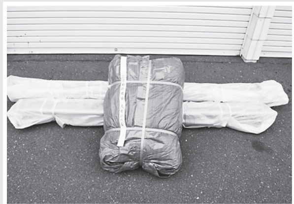
↑ 助成により購入した行事用テント