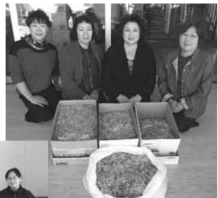
別海町商工会女性部 様