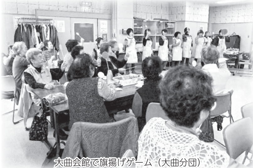
大曲会館で旗揚げゲーム（大曲分団）