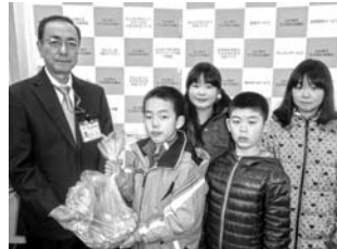
北の台小学校リングブル等の寄贈