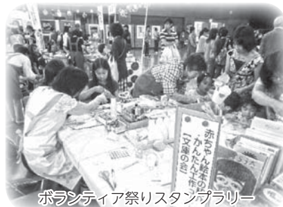
ボランティア祭りスタンプリナー