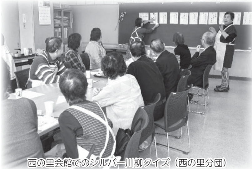
西の里会館でのシルバー川柳クイズ（西の里分団）

ホームページアドレス http://kitahiroshakyo.ec-net.jp