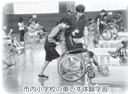
市内小学校の車いす体験学習