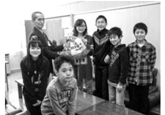
双葉小学校リングブル等の寄贈