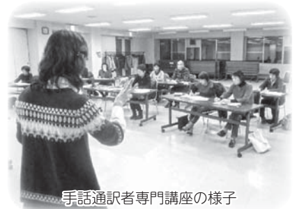
手話通訳者専門講座の様子