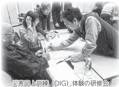
災害図上訓練(DIG)体験の研修会