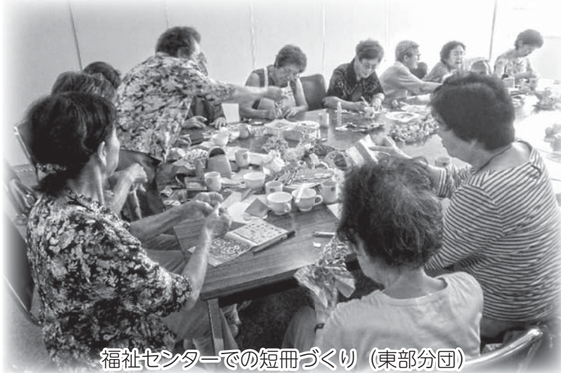
福祉センターでの短冊づくり（東部分団）