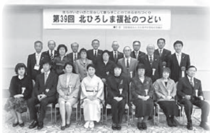
第39回北ひろしま福祉のつどい受賞者

平成27年度から平成32年度までを計画期間とする「第6期地域福祉実践計画」を策定しました。