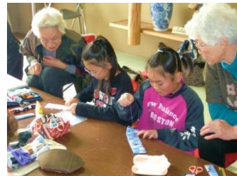
北海道夕張高等養護学校さん 授業の一環として交流