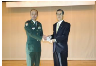
第72戦車連隊陸曹団 様 夕張市立夕張中学校 様