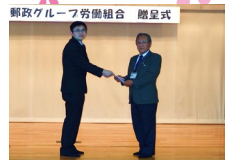
日本郵政グループ労働組合 様

夕張市立夕張中学校保体常任委員会様 18,250円 日本郵政グループ労働組合様 1,000,000円 特定非営利活動法人 札幌・障害者活動支援センターライフ様 白い恋人 90箱 北海道コカ・コーラボトリング株式会社様 飲料水 21ケース 480本 株式会社東芝様・東芝ウィズ株式会社様・シチズン夕張様・久保田総合印刷様 カレンダー150部・手帳 30部 北海道夕張高等養護学校生徒会様 4,350円 老人福祉会館利用者御一同様 54,935円 他 匿名 12件