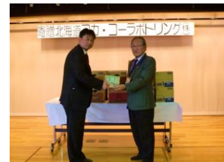
北海道コカ・コーラ ボトリング株式会社 様