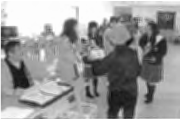
↑ イベント募金の様子

皆様から寄せられました募金は、北海道共同募金会に送金後、平成26年度実施事業として置戸町内の福祉団体やボランティア団体、小地域ネットワークに助成いたします。また、置戸町内の福祉活動の事業費として有効に活用させていただきます。