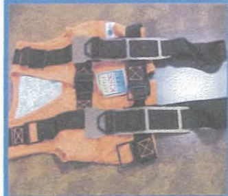
チャイルドシート（着用式）