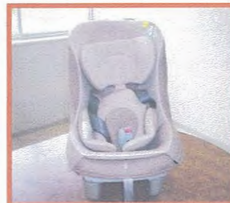
チャイルドシート