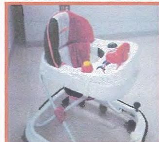
ベビーウォーカー