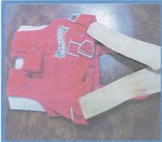
チャイルドシート（着用式）