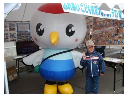
【写真は昨年度の様子】