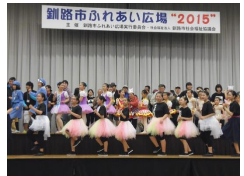
【釧路市ふれあい広場 2015 フィナーレの様子】

28日は(日)「市民ふれあい広場」が行われました。およそ2か月間に渡り、多くのボランティアさんが準備を進めてきましたが、当日は子どもから大人まで楽しめる企画が行われ、参加された皆さんから非常に好評で成功裏に終了することができました。