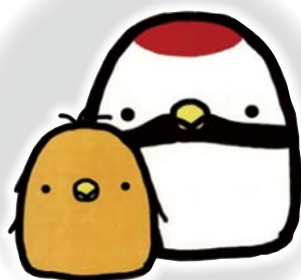
つるぼー&ひなぼー