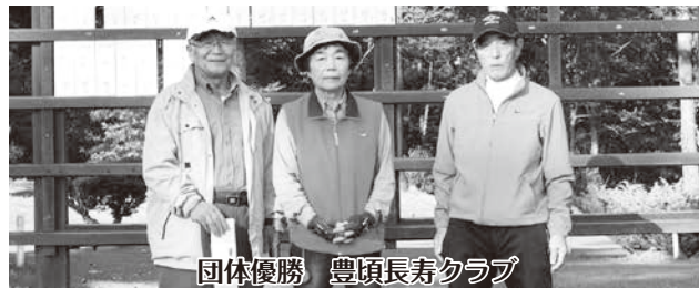
団体優勝 豊頃長寿クラブ