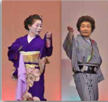
シニアの舞踊も盛り上がりました