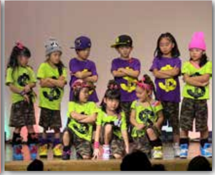
会場も揺れたサロマキッズダンス

平成27年11月3日文化の日 佐呂間町町民センター会場 当日来場者403名、出演43組