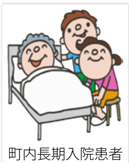
町内長期入院患者