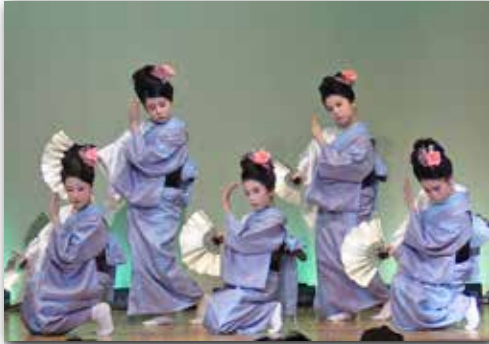
若柳臣流若寿会による日本舞踊