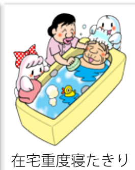
在宅重度寝たきり