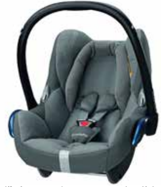
貸出用ベビーシート（画像）