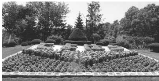
優良賞 豊原連合町内会