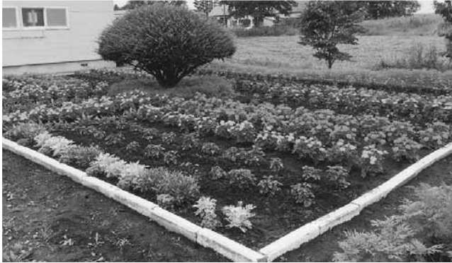
最優秀賞 本久町内会