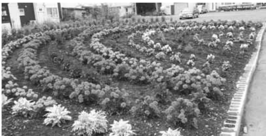
優秀賞 西春別駅前連合町内会