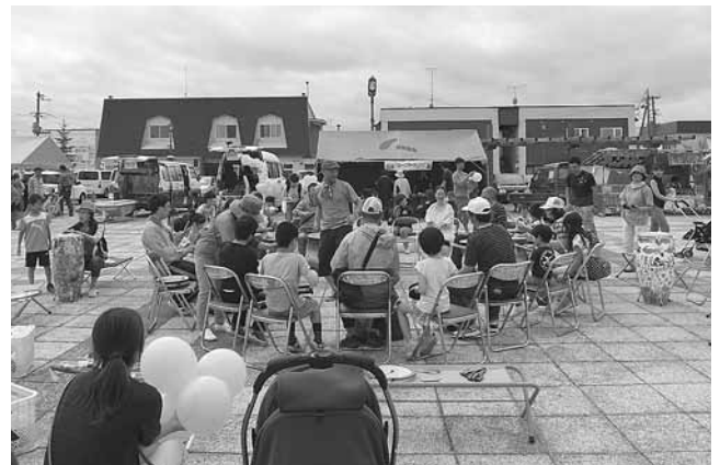
参加者皆でドラム・サークル