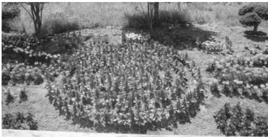
奨励賞 床丹町内会