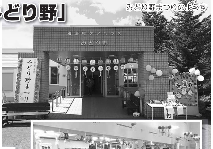
みどり野まつりのようす

「自炊が大変になってきた」と感じている方、入居についてのご相談・施設の見学などお気軽にお問い合わせください。