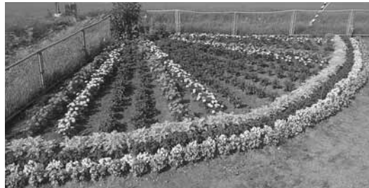
優秀賞 別海寿町内会