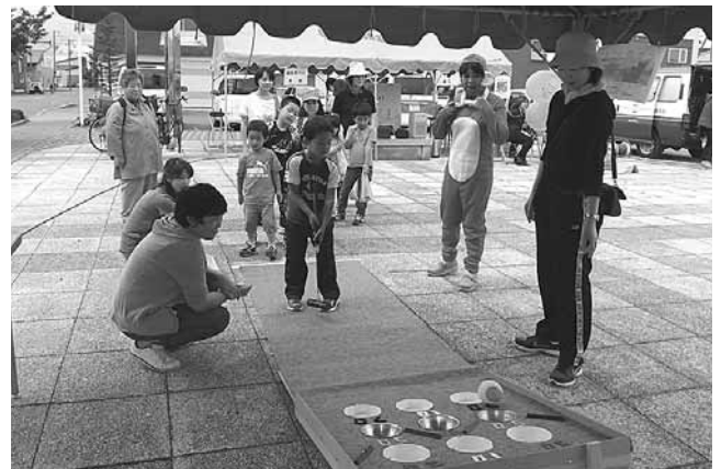
ころがってポコは子どもにも楽しめます