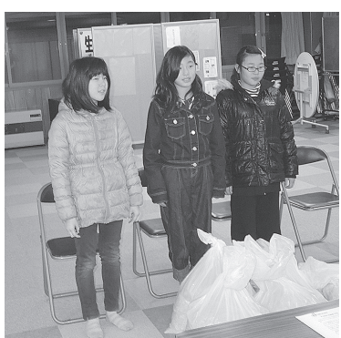
茶内第一小学校児童会の皆さん

社会福祉法人浜中町社会福祉協議会 〒088-1513 浜中町霧多布東3条1丁目(浜中町老人福祉センター内) 電話:0153-62-5016(直通) FAX:0153-62-3049 E-mail:krh31chi@atlas.plala.or.jp しゃきょう介護センター「えぞふうろ」 電話:0153-62-5252 E-mail:ezofuuro@bz04.plala.or.jp しゃきょう介護プランセンター「あじさい」 電話:0153-62-3717 E-mail:ajisai@bz04.plala.or.jp