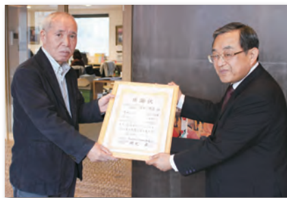
株式会社はなまる様

ご寄付にかかわるご相談は、総務課でお受けしております。(電話 614-3345)