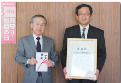
JFE条鋼株式会社 豊平製造所様