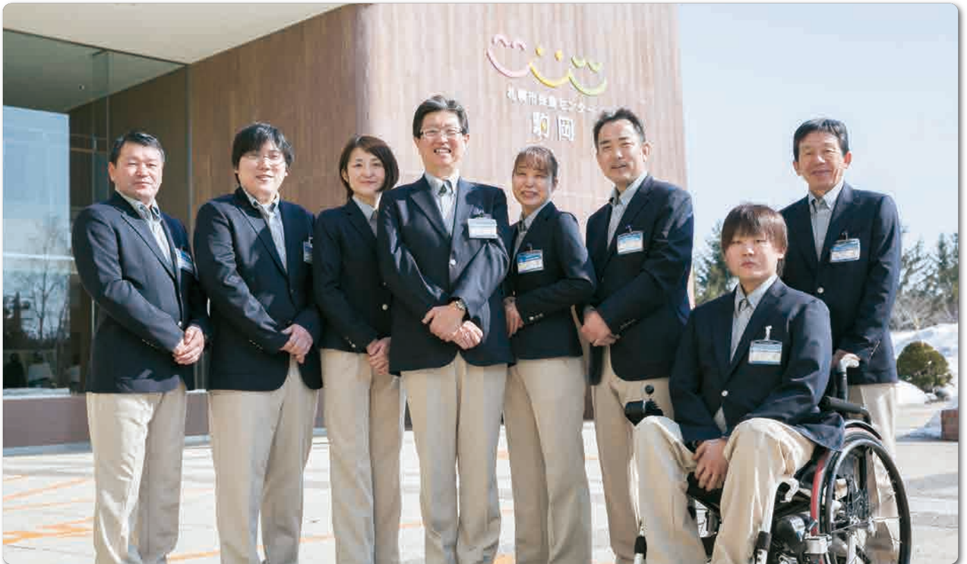
保養センター駒岡は、4月1日からリニューアルオープンしました。皆さまのお越しを、私たち職員一同、心よりお待ちしております。(関連情報は5頁に)