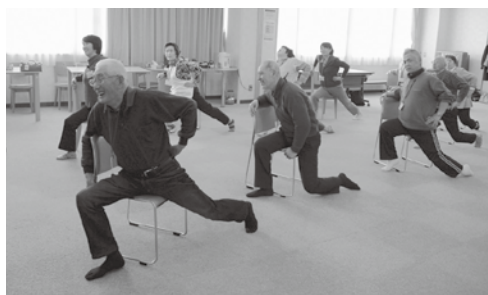
健康体操でストレッチ

本年度の「ひだまりサロン」は赤い羽根共同募金の助成金を活用し、運営されています。