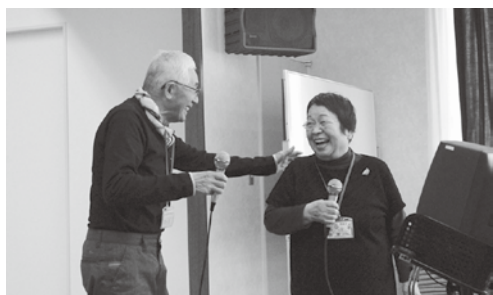
1曲歌い終わって、笑顔