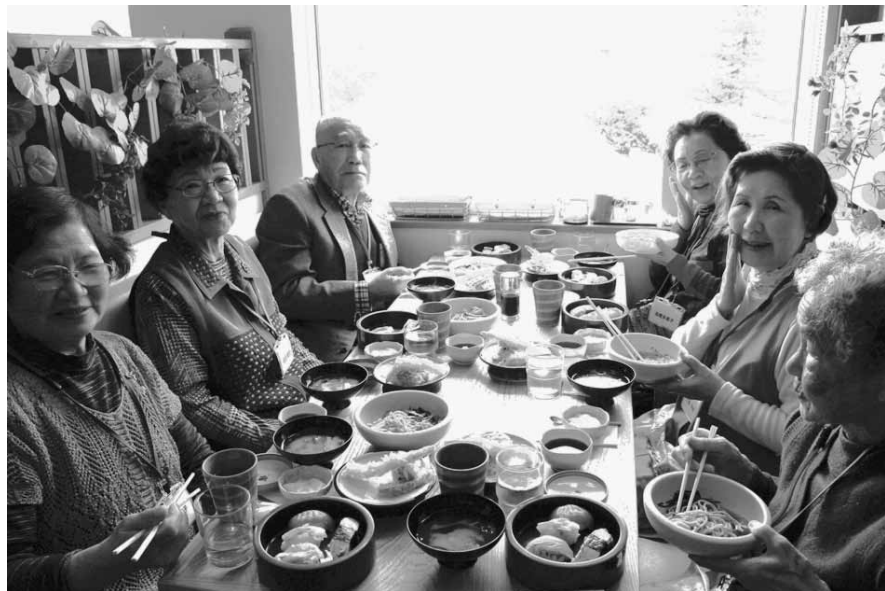
「すしはん Garden」にお邪魔して 美味しいランチをいただきました！