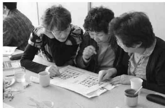
「あった！ちょっと、ねえ、ココじゃない？」 「あら～、同じに見えちゃうけど」