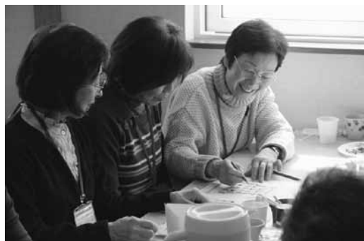
食事のあとは「まちがいさがし」などで遊びました