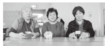
牛乳パックでリサイクル手芸