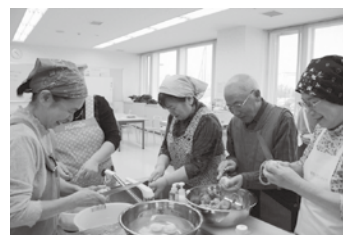
ポテトサラダ作り