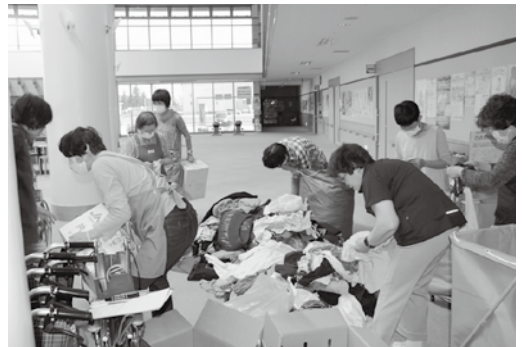
古衣料の仕分けと発送準備

古切手につきましては、4月から事務所のカウンターに「古切手回収箱」を設置しました。手作りの小さな箱ですが、今後はそちらにお入れください。受領書の発行と、社協だよりへのお名前掲載はなくなりますので、ご了承ください。