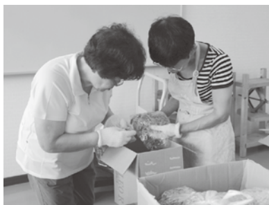
リングプルの分別、整理

古衣料については、送り先が受け入れてくれるものとダメなものがあります。大体のものは大丈夫ですが、「これはいいかな？」と疑問に思われたときは、気軽に社協までお問い合わせください。