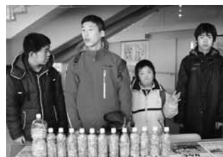
南幌養護学校中学部様

送ったリングプルは、合計が一定のキロ数に達すると車椅子等と交換することができます。社協が貸し出している車椅子の中にも、皆様がお寄せくださったリングプルで交換したものが何台もあります。お陰様で施設や個人の方にご利用いただいています。