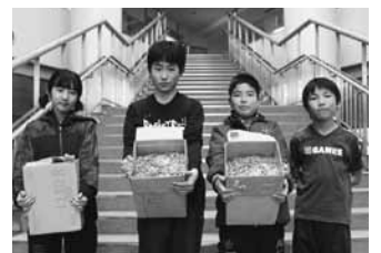
南幌小学校児童会様