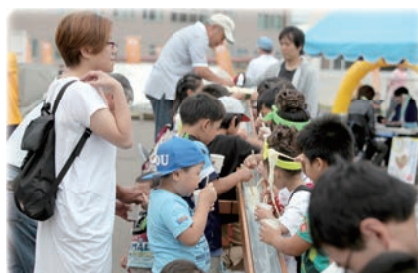
流しソーメンは、子どもの部が大盛況で、何度も麺を追加しました