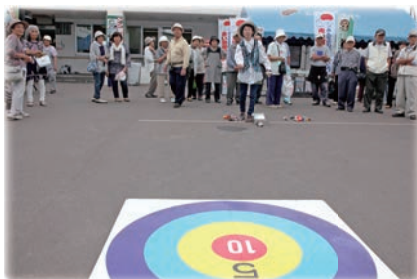
恒例のゲーム大会には、150名以上の方に参加頂きました