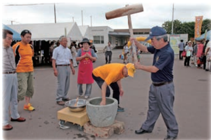
開会記念のモチつきは、川根町長からはじまり、お汁粉募金として振る舞われました