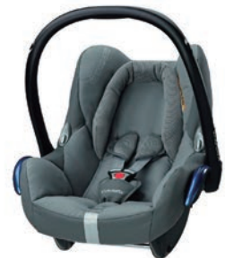
貸出用ベビーシート

社会福祉協議会 (図書館向かい) に印鑑持参でお越しください TEL 2-3732