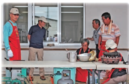
民生児童委員には、昼食調理だけでなくイベント運営にもご協力頂きました