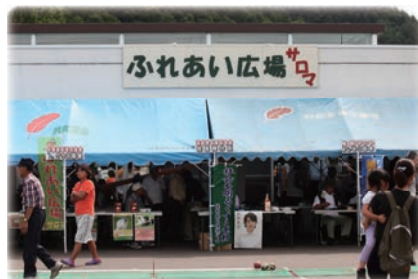
ふれあい広場のカンバンが見やすい新しいものになりました