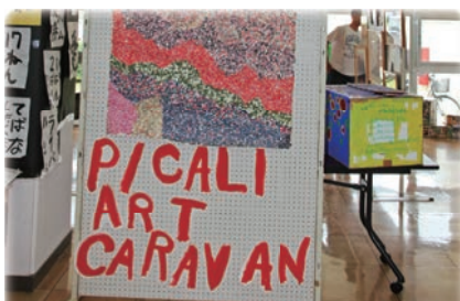
向陽園の利用者も生田原から駆けつけ一緒に作り上げた、ぴかりアート