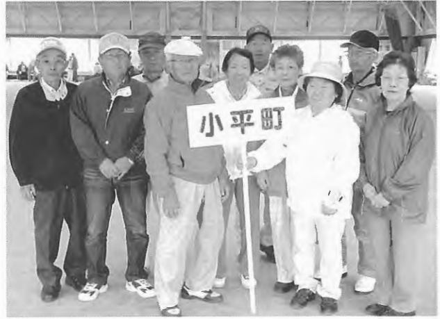
第34回留萌地区高齢者ゲートボール交歓競技大会参加者