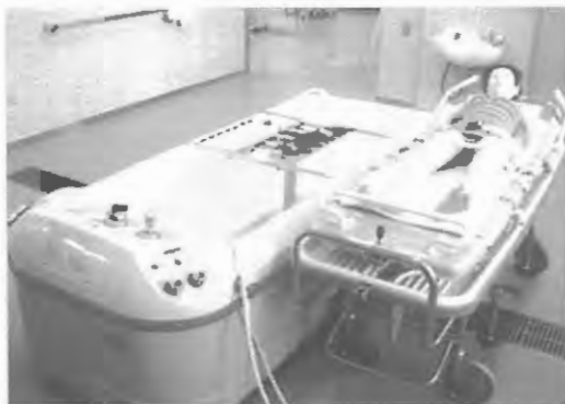
置戸高校入浴実習室

小平町民生委員協議会では、隔年で1泊2日の視察研修事業を実施しています。今年の視察先旭川地方裁判所では、裁判員制度や裁判所の仕組み等について説明を受け2日目には網走管内の道立置戸高校（道内唯一の福祉専攻科）では、介護福祉士資格取得のためのカリキュラムや奨学金制度等について説明を受け校内の実習室の見学をさせていただきました。