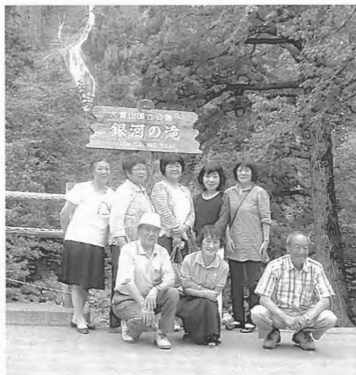
層雲峡「銀河の滝」にて