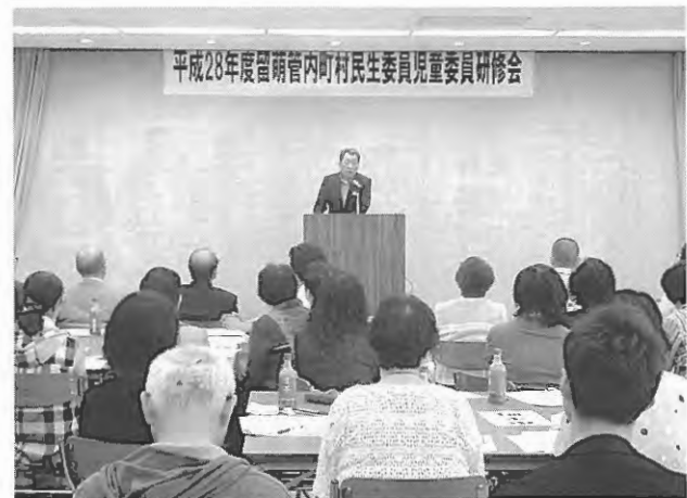
留萌管内町村民生委員研修会