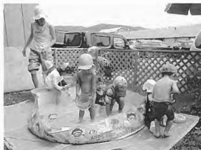
夏本番、待ちに待ったプール遊び