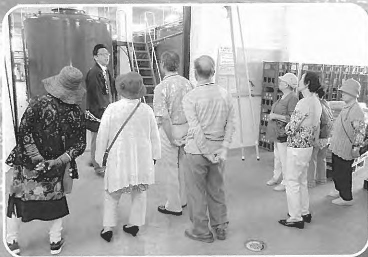
旭川「明治高砂酒造」見学