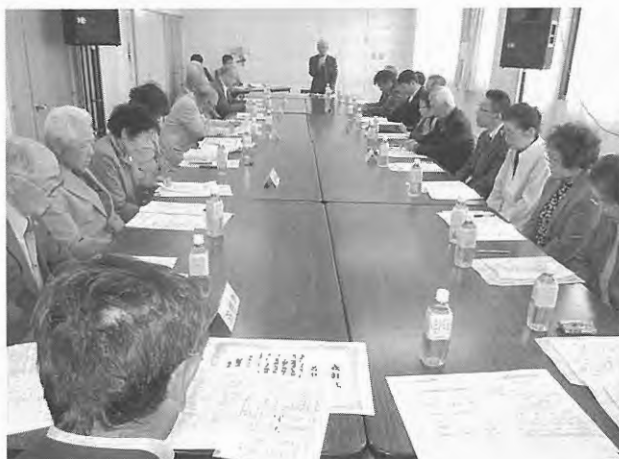
留萌地区連合遺族会総会