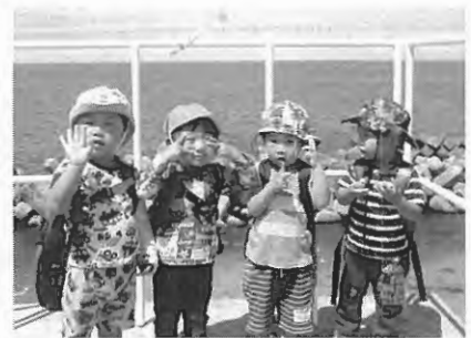
小平の浜まで散歩に行ってきました