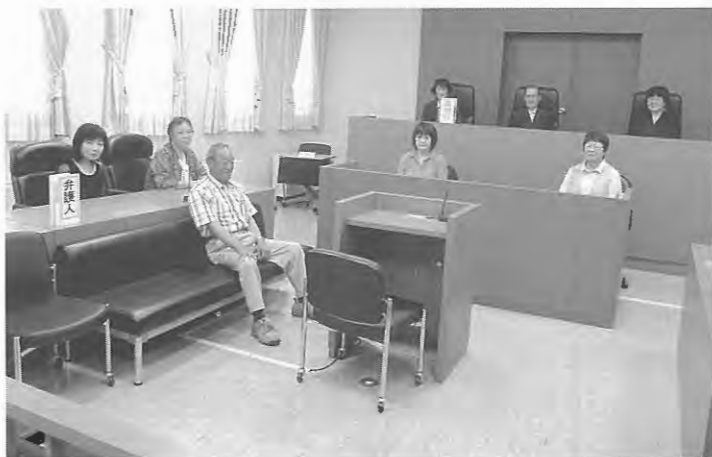
旭川地方裁判所視察