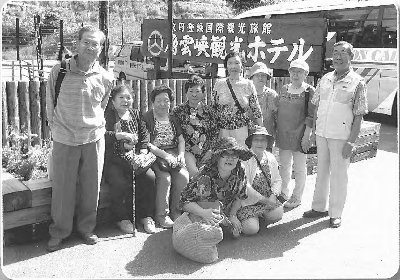
身体障害者福祉協会研修旅行