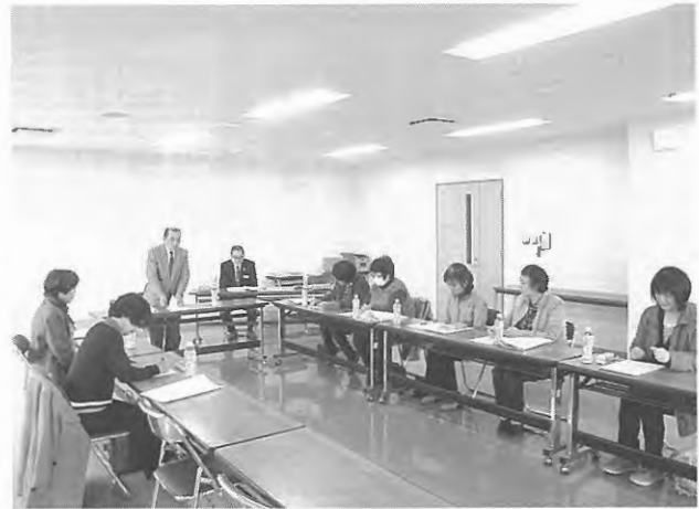
民生委員協議会総会