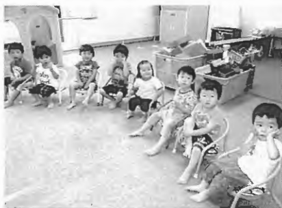
全員集合でパチリ大所帯です