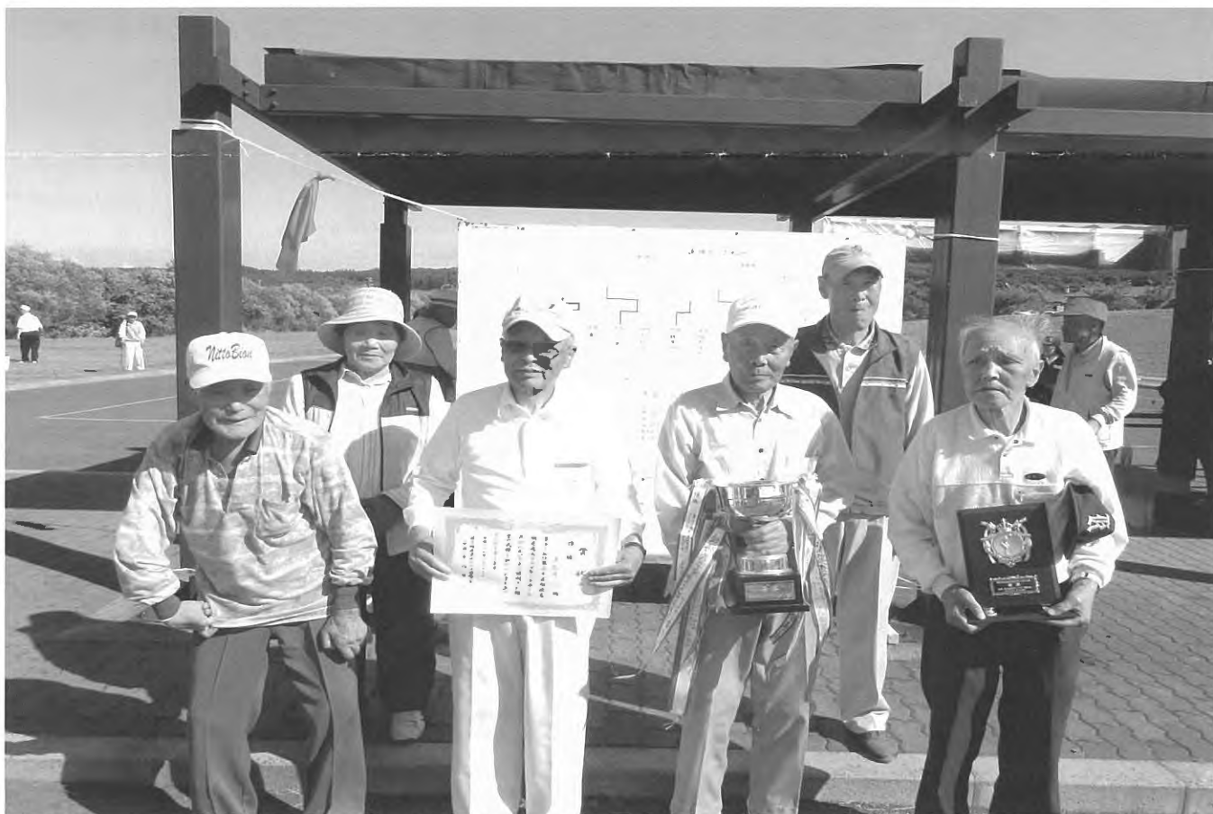
【第35回後志地区老人クラブゲートボール大会（共和町）】 黒松内町合同チームで大会に参戦。なんと！初優勝！！ みなさん持てる力を発揮して、見事優勝カップを持ち帰りました！