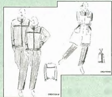
【株式会社O. D. O】

福祉施設で働く職員向けに、機能的で、さらにかっこいい制服をプロのデザイナーがデザインします！