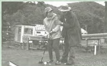
【株式会社太陽グループ】

障がいをもった方が「雪」や「草花」に触れる体験の場と安心して体を動かせる遊びの場を提供します！