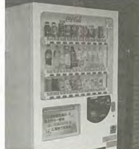
建物正面に設置の自動販売機。皆さん方が1本お買い上げのたびに10%が共同募金へ寄付されます。