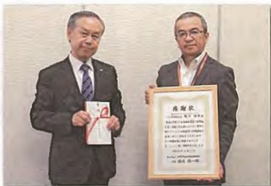
株式会社ツルハホールディングス 様