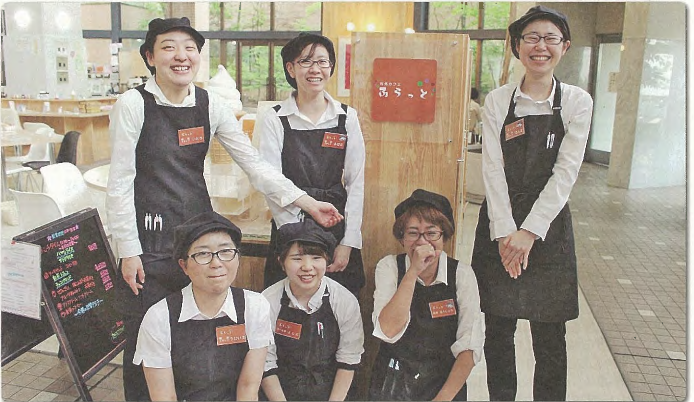
この笑顔に癒される方、増えてます。 気になる方は、総合センター1階のカフェ「ふらっと」にぜひ立ち寄ってみてください。