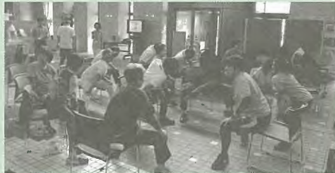
【札幌スパインクリニック】