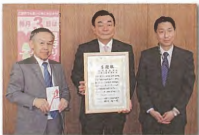
札幌菱友会・三菱業務懇談会 様