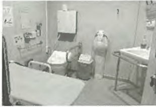
「多目的トイレ」は、車いすの方の設備やオムツ交換のベッド、オストメイトの設備があります。

センターには各種清涼飲料の自動販売機も設置しておりますので、水分補給にお使いください。