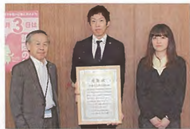
佐藤水産株式会社 様

ご寄付にかかわるご相談は、総務課でお受けしております。(電話 614-3345)