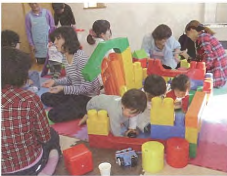
↑遊びや交流を通して親子がのびのびできる場として運営されています。