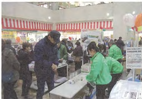
↑募金活動の一環として、カレンダーリサイクル市を開催しています。