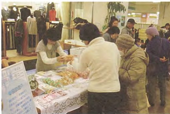
↑市内授産製品の即売会「ふれあい・きずなショップ」を開催しています。