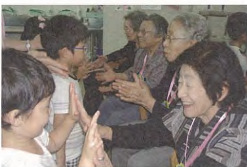
↑デイサービスでは子どもたちとの触れ合いも大切にしています。