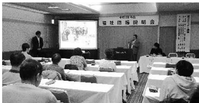
↑ 就活セミナーの様子

11月26日(土)にホテル黒部に於いて福祉職場説明会を開催しました。午前は『就活セミナー』、午後は職場面談を行い、就活セミナーでは職場面談に参加された事業所の中から高齢分野(株)S.M.Y緑の丘様・障がい分野(網走桂福祉会サンライズ・ヨピト様)・児童分野(北海道家庭学校様)から福祉職場の魅力や求める人材像についてご講演頂き、午後からの職場面談には、20法人が参加し、来場者と仕事の内容や職場についてお話していただきました。