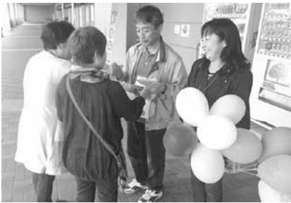
▲街頭募金運動の様子