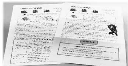
▲アシスタントが毎月作成している情報紙「散歩道」

人生にはきっかけや出会いがあると思いますが、平成元年の時「ワープロでボランティアをしませんか？」の募集記事に出会わなければ、今のアシスタントの私はなかったかもしれません。