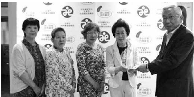
▲日赤奉仕団中央分団様より平成 28 年熊本地震の義援金を

日本各地で発生する地震や台風などの災害義援金も受付しています。義援金は被災地の共同募金委員会をとって被災者にお届けしています。