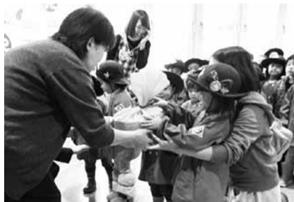
▲高栄幼稚園の園児の皆様より