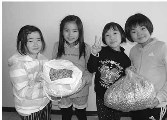
中央児童館 児童クラブ 様