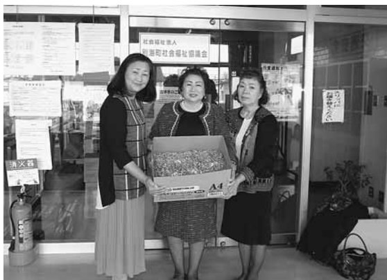
別海町商工会女性部 様

中央児童館 児童クラブ 様 中春別農業協同組合 様 ボランティア組織そよかせ 様