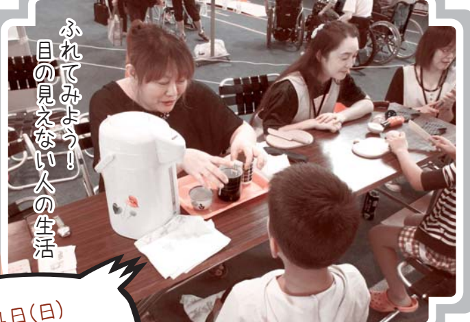
ふれてみよう！ 目の見えない人の生活