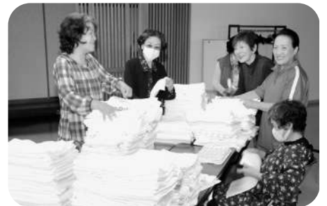
◆9月18日 老人クラブ連合会タオルほか