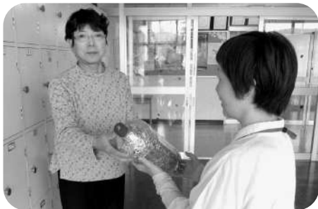
◆6月8日 豊里小学校リングプル