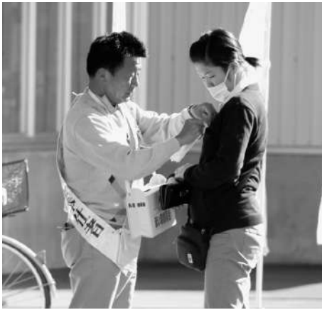
□NPO市民活動支援センター (コープさっぽろ)