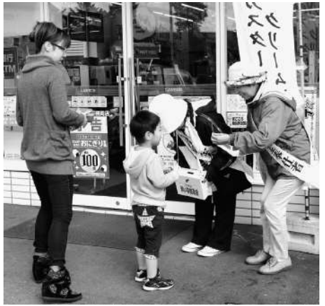
□赤平手話の会 (幌岡ローソン)