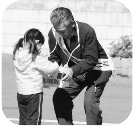
□茂尻5町内連合・百戸町 (茂尻セブンイレブン)