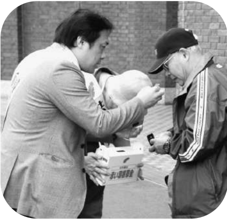
□青少年育成連絡協議会 (交流センターみらい)