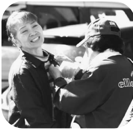
□婦人団体連絡協議会 (赤平市役所)