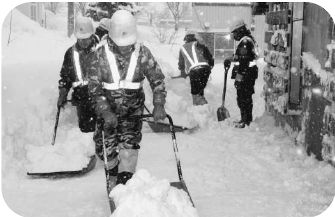
植村建設(株)の皆さん（幸町、桜木町、美園町、文京町、錦町地区）