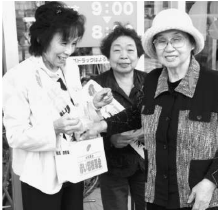
□ボランティアセンター来夢 (コープさっぽろ)