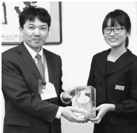
□中央中学校生徒会 (中央中学校)