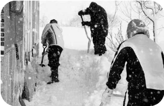
自衛隊滝川駐屯地の皆さん（共和町、茂尻春日町、茂尻新町、栄町地区）

社会福祉協議会が町内会から依頼を受けたお宅の現状調査の上、22 世帯に出動、家の周り、裏窓、ベランダに積もった雪を除雪しました。隊員・社員の皆さま、ありがとうございます。