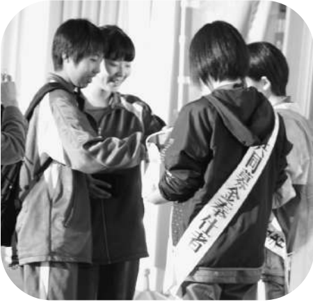
□赤平中学校生徒会 (コープさっぽろ)