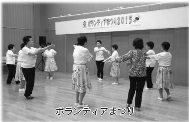
ボランティアまつり