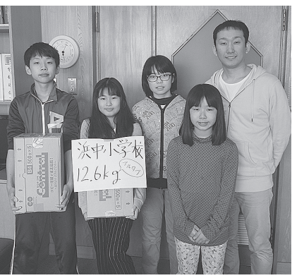
平成29年3月 浜中小学校のみなさん