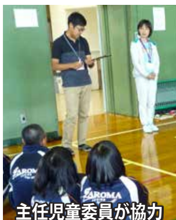
主任児童委員が協力