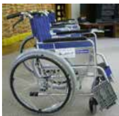
車イス（自走式・介助式）