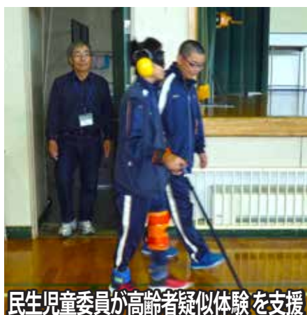
民生児童委員が高齢者疑似体験を支援