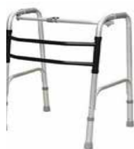
歩行器（固定式・ﾀｲﾁ付）