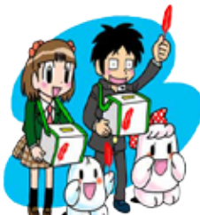
ボランティア講座