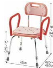
シャワーチェアー