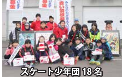
スケート少年団 18名

10月11日、佐呂間スピードスケート少年団（18名）による街頭募金活動が、佐呂間農協・Aコープサロマ・サンショップよしの・セブンイレブンで行われました。