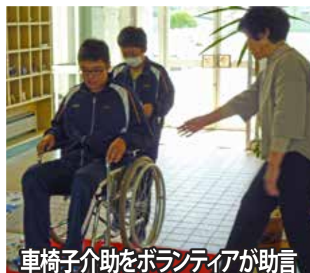
車椅子介助をボランティアが助言