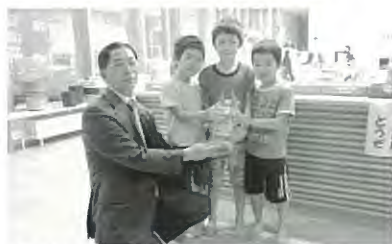
幼児センター児童