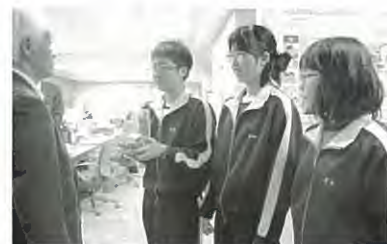
ニセコ中学校生徒会