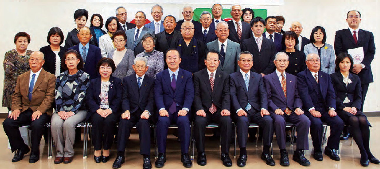
岩見沢市社会福祉協議会 社会福祉功労者表彰式