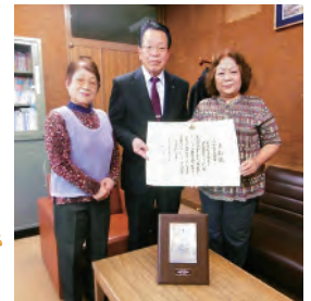
若松地域給食ボランティア