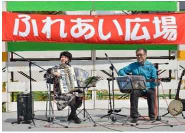
第15回ふれあい広場