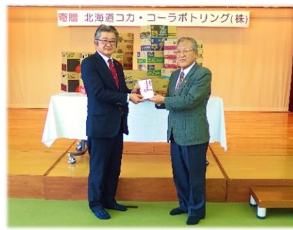
北海道コカ・コーラ ボトリング株式会社 様 飲料水 22ケース(560本)