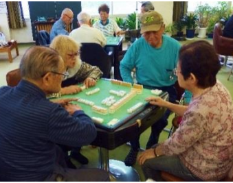
囲碁・麻雀・将棋大会