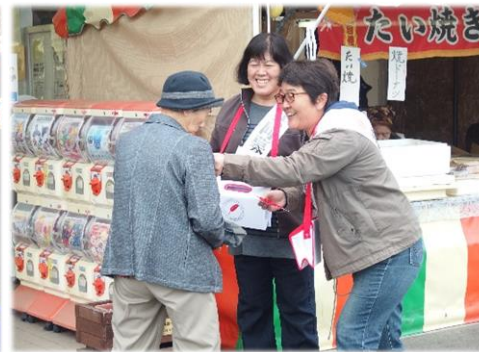
街頭募金のようす