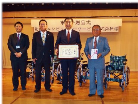
北日本コンピューター サービス株式会社 様 車椅子5台

特定非営利活動法人 札幌障害者活動支援センターライフ 様 美冬30ケース(390箱) 株式会社東芝 様 東芝ウィズ株式会社 様 市内企業6社 様 カレンダー320部・手帳90冊