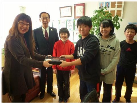
ゆうぱり小学校児童会 様