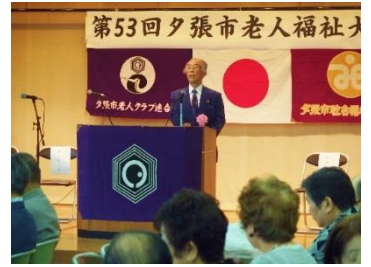
夕張市老人福祉大会