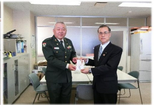
第72戦車連隊陸曹団 様