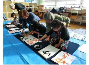
学童クラブと書道サークルの世代間交流