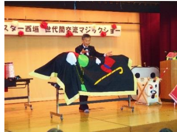
ミスター「西垣」世代間交流マジックショー