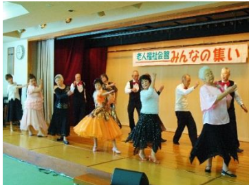
会館 みんなの集い