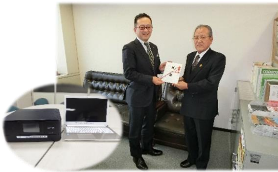
一般社団法人 生命保険協会 苫小牧協会 様 パソコン1台 プリンター1台