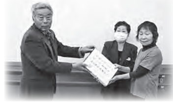
←茂寄もみじクラブ様は、定例会等で集まった一年分の募金箱を昨年に引き続き福祉事業へと寄附されました。

※ご寄附は所得控除の対象となります。ご協力いただける方は、社会福祉協議会までご連絡ください。