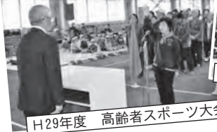
H29年度 高齢者スポーツ大会