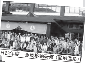
H28年度 会員移動研修 (登別温泉)