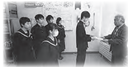
←広尾中学校生徒会様は、校内で集めたリングブル・ペットボトルキャップ・牛乳パックを売却し、昨年に引き続き社会福祉事業へと寄附されました。