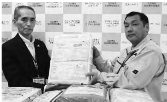
(株)サッポロドラッグストアからの寄贈

桜ヶ丘熟年会 (190枚) / 赤十字奉仕団大曲分団 (400枚) / 赤十字奉仕団東部分団 (760枚)