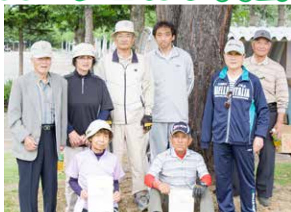
選手・応援者で記念撮影