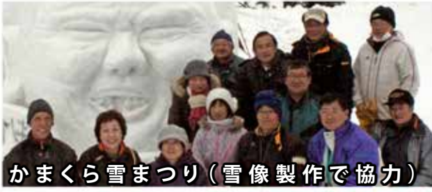
かまくら雪まつり（雪像製作で協力）