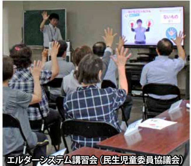
エルダーシステム講習会（民生児童委員協議会）

民生児童委員は、地域を見守る身近な相談相手として、地域福祉の一端を担っています。その活動は、社会福祉協議会にも欠かせない存在であり、ふれあい郵便や、在宅ひとりぐらし高齢者の集い、ふれあい広場など、社協の各種事業にご協力をいただいております。前号でご紹介した、エルダーシステムを活用した、健康増進活動（総合事業）にも、民生児童委員協議会（6月5日開催）で、いち早く講習していただきました。サロマしゃきょうは、民生児童委員と連携して、地域の問題解決に取り組んでいきます。