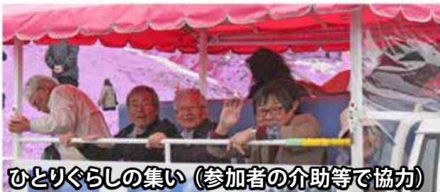
ひとりぐらしの集い（参加者の介助等で協力）