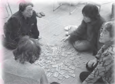
新年会 『百人一首、久しぶり〜』