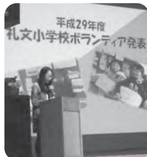
ボランティア発表会