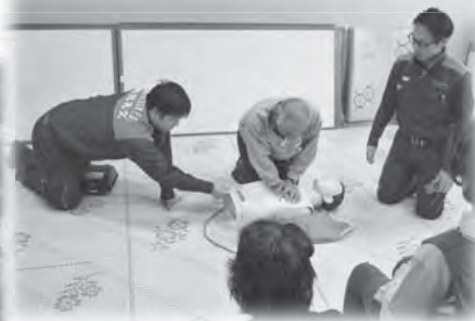
AED講習 講師：消防署職員