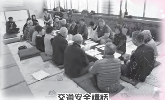
交通安全講話 講師：駐在所職員