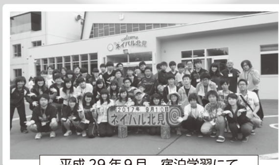
平成 29 年 9 月 宿泊学習にて

申し込み・問い合わせについては、上記の電話番号または メールアドレスまでご連絡をお願いします。