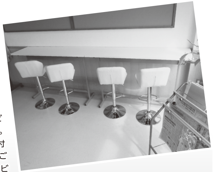
パステルイエローのチェアです♪勉強や読書スペースに!!

カウンターテーブルを設置。勉強や読書などにご利用下さい。また、USB端子付きのコンセントもご用意。また、ロビー内にはお茶やお菓子もご用意しておりますので、「ちょっとひと休み」にどうぞご利用下さい。