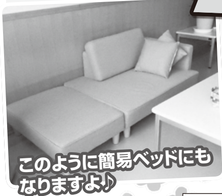
このように簡易ベッドにもなりますよ♪

※展示会は、入場料無料をお願いいたします。 ※営利目的の展示会や、企業様の展示等はお断りいたします。