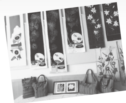
写真はサークル恵布様の展示会の様子 H29.5 撮影