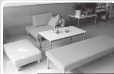
普段は2つのソファとして使用できます!

おしゃれなソファもあります。普段はソファとして、また災害が発生した際は、簡易ベッドとしても活用出来ます。