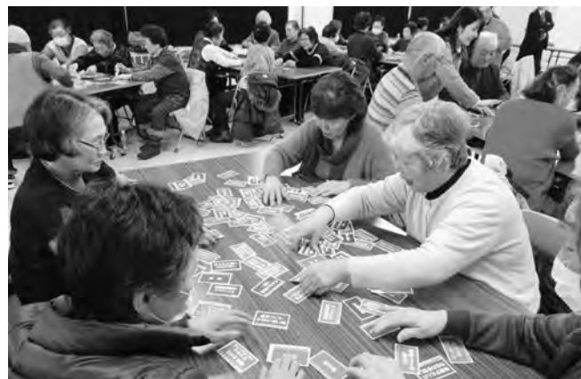
▲カードを使った「助け合い体験ゲーム」で51名の参加者の皆様大盛り上がり♪