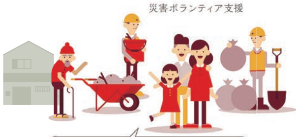
災害ボランティア支援