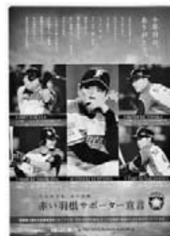
日本ハムファイターズ