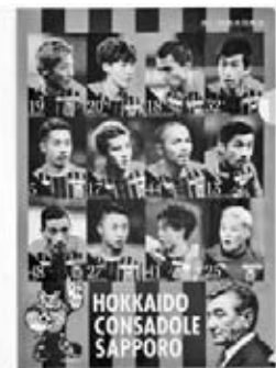
北海道コンサドーレ札幌