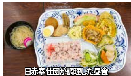
日赤奉仕団が調理した昼食