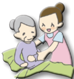
在宅重度寝たきり