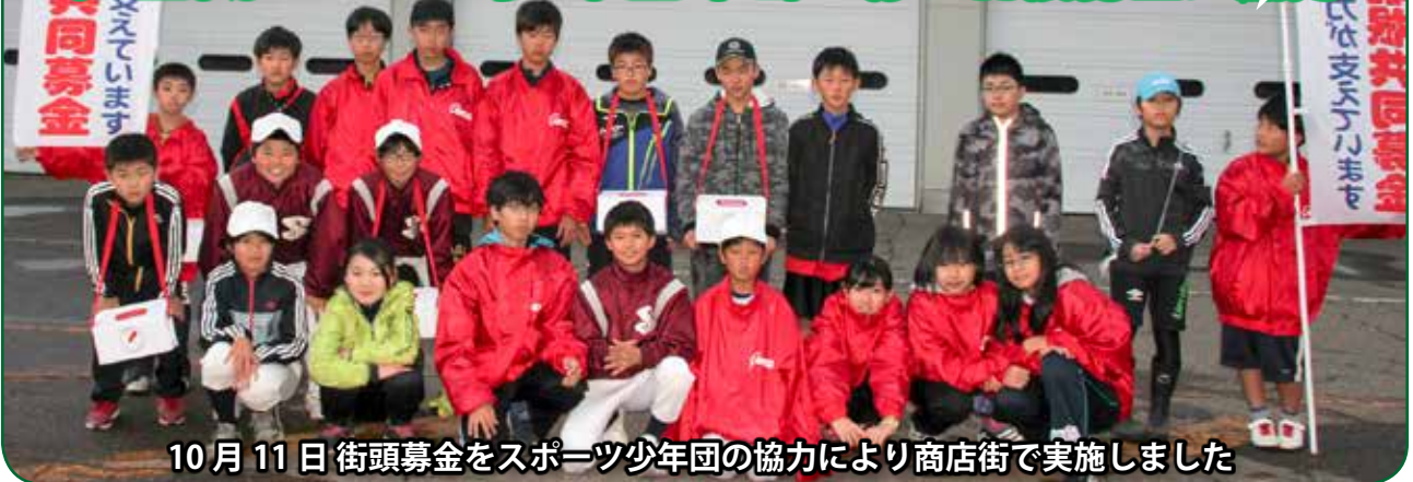
10月11日 街頭募金をスポーツ少年団の協力により商店街で実施しました