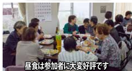
昼食は参加者に変大好評です