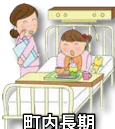
町内長期入院患者

安全で安心なまちづくりの活動など、「じぶんの町を良くするしくみ」として幅広く地域の福祉のために活かされます。