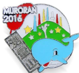
2016 測量山バッジ (室蘭八景シリーズ)