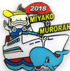
2018 フェリーバッジ (岩手県宮古市への フェリー就航記念)