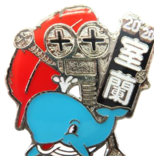
2020 ボルタバッジ (ものづくりのまち室蘭)