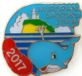
2017 大黒島バッジ (室蘭八景シリーズ)