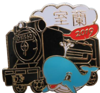
2019 S Lバッジ (炭鉄港シリーズ)