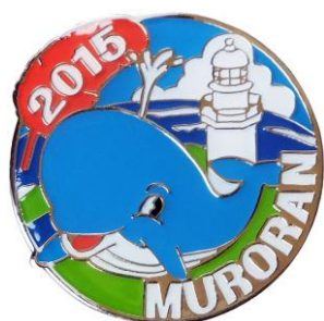
2015 地球岬バッジ (室蘭八景シリーズ)