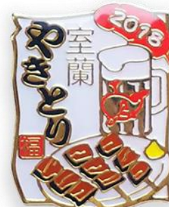
2018 室蘭やきとりバッジ (B級グルメシリーズ)