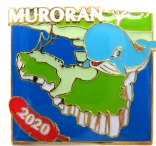
2020 室蘭の地形バッジ (馬蹄型のまち室蘭)