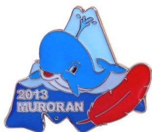
2013 くじらんバッジ (室蘭市のマスコット)