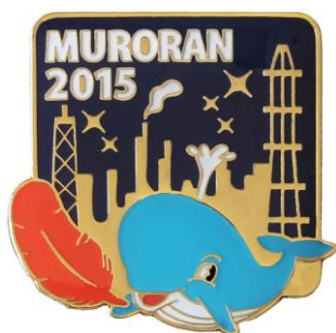
2015 工場夜景バッジ (室蘭八景シリーズ)