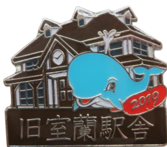
2019 旧室蘭駅舎バッジ (炭鉄港シリーズ)