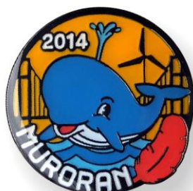
2014 白鳥大橋バッジ (室蘭新名所)