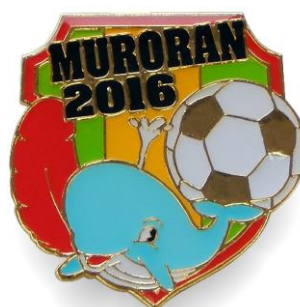
2016 サッカーバッジ (サッカーのまち室蘭)