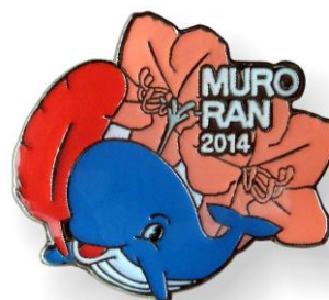
2014 ツツジバッジ (室蘭市の花)