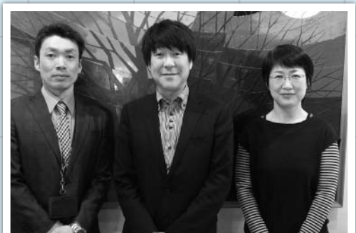
私たちが権利擁護センタースタッフです