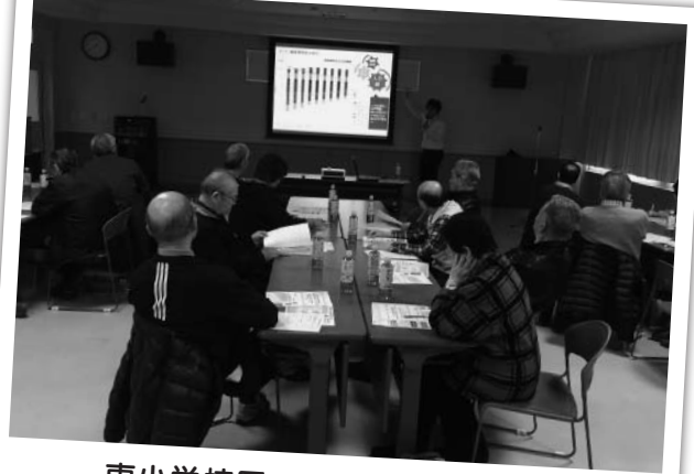
東小学校区での地域福祉懇談会 平成31年3月22日(金) 参加者19名