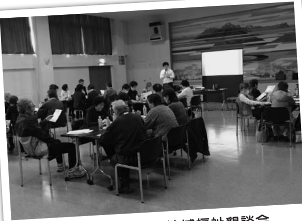
山部小学校区での地域福祉懇談会 平成31年3月20日(水) 参加者34名

地域福祉懇談会は、地域の福祉（幸せ）について地域の皆さんと一緒に懇談し、活動につなげていく場です。今後も、地域の皆さんとともに、地域の福祉（幸せ）作りを進めていきますので、ご協力お願いいたします。