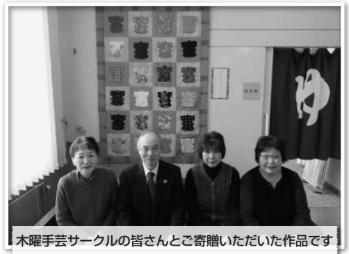
木曜手芸サークルの皆さんにご寄贈いただいた作品です

現在デイサービスいちいにて飾らせていただいております。会を発足して今年で11年目になるとのことです。着物の生地を使った作品で一つ一つがとても細かい作品です。着物の配置にも工夫されたと教えていただきました。デイサービス利用者の方も綺麗だねと喜んでいました。昨年に引き続き、この度はご寄贈いただきありがとうございます。