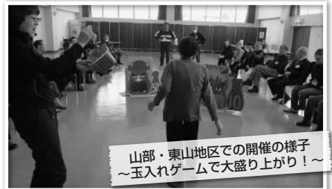
山部・東山地区での開催の様子 ～玉入れゲームで大盛り上がり！～

平成31年度もふれあいの集いを開催いたします。参加対象者の方はぜひ登録してくださいね。また、皆さんとお会いできるのを楽しみにしています。