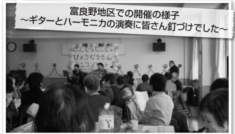
富良野地区での開催の様子 ～ギターとハーモニカの演奏に皆さん釘づけでした～