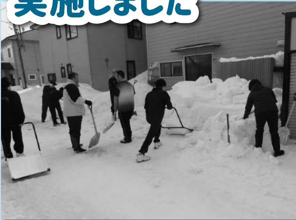
寒さに負けない!元気に除雪ボランティア! ありがとうございます!

今年も、富良野高校様、緑峰高校様、東中学校様、西中学校様、山部中学校様、富良野地区連合会様のご協力のもと、除雪ボランティアを実施することができました。