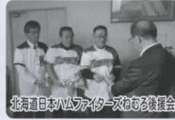
北海道日本ハムファイターズねむる後援会