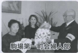
駒場第一町会婦人部

令和元年10月1日から令和2年1月31日までに皆さまから寄せられた善意を紹介いたします