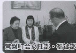
常盤町会女性部・福祉部