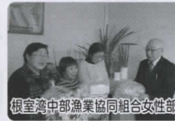
根室湾中部漁業協同組合女性部