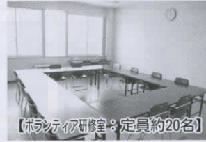
【ボランティア研修室：定員約20名】