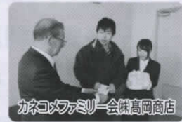
カネコファミリー会榊高岡商店