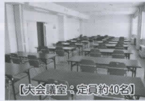
【大会議室：定員約40名】