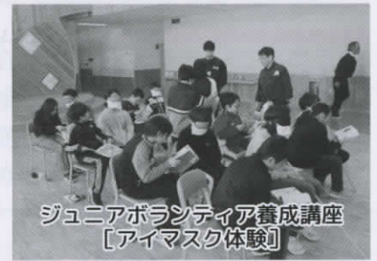
ジュニアボランティア養成講座 【アイマスク体験】

ボランティアの育成や調整を実施し、市内でボランティアに取り組む方々を応援しております。ジュニアボランティア養成講座では、市内の小・中学校を対象に「手話の学習」、「車いす体験」、「アイマスク体験」、「高齢者疑似体験」といった出前型体験講座を実施し、児童・生徒とともに助け合い生きることの大切さを学んでいただいております。