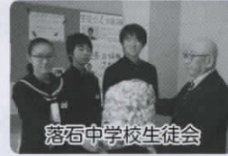
落石中学校生徒会