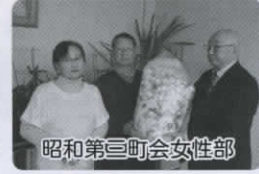
昭和第三町会女性部