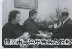
根室市青色申告会女性部