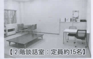
【2階談話室：定員約15名】