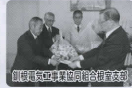
釧根電気工業協同組合根室支部