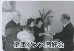
健康ダンス同好会