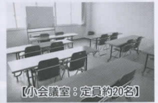
【小会議室：定員約20名】